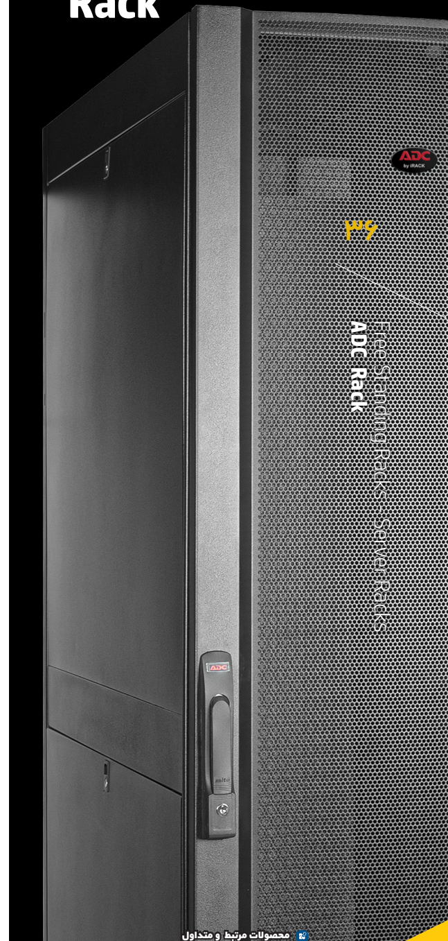
محصولات مرتبط و متداول