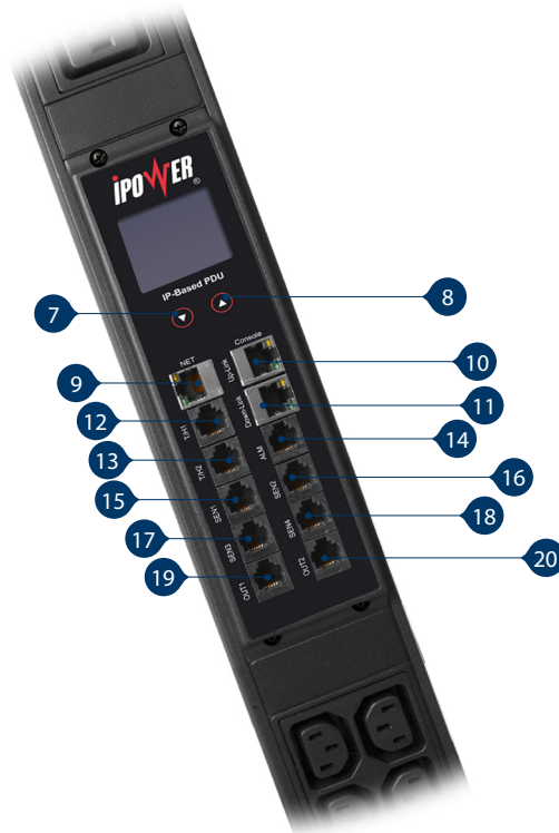
Controlling Module Introduction